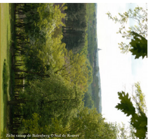
Zicht vanop de Balenberg