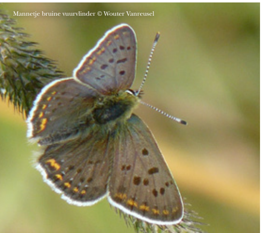
Mannetje bruine vuurvlieder

Baal is een deelgemeente van Tremelo, én bekend van het veldrijden. IJzerzandsteenheuvel 'Balenberg' herbergt een 7 ha groot beuken- en eikenbos. En een zeldzame fladderaar vertoeft hier graag. Benieuwd? Vertrek aan het Sven Nys Cycling Center en ontdek al wandelend het landschap op en rond de Balenberg!