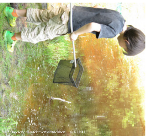
Het boeiende waterleven ontdekken...