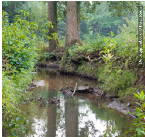
De Begijnenbeek

Assent is een deelgemeente van Bekkevoort en herbergt 'Wissenbeemd' dat verkozen is tot het mooiste plekje van de gemeente. Je wandelt doorheen de Begijnenbeekvallei, over de Hermansheuvel, langs boomgaarden en holle wegen.