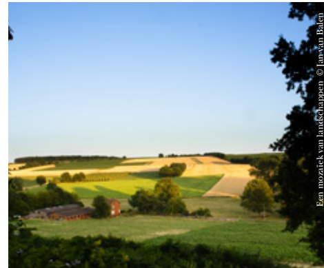
Een mozaïek van landschappen © Jan van Baten