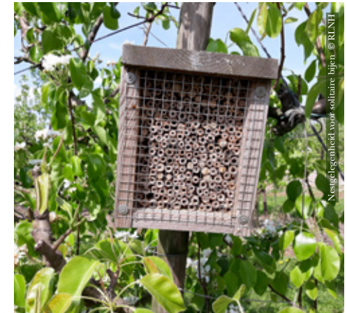
Nestgelegenheid voor solitaire bijen